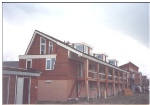
Eerste woningen bijna klaar

Wat in het algemeen jammer is dat het bewonersboek voor de oplevering van de eerste fase nog niet gereed was en is. Als je gaat verhuizen en een nieuwe woning gaat inrichten is informatie over ecologische alternatieven m.b.t. bouwmaterialen en inrichting van de woning zeker nuttig. Ook is het goed om te weten wat wel en niet mag als het gaat om de waterhuishouding van de wijk. Het wordt concreet en dan is concrete informatie nodig.